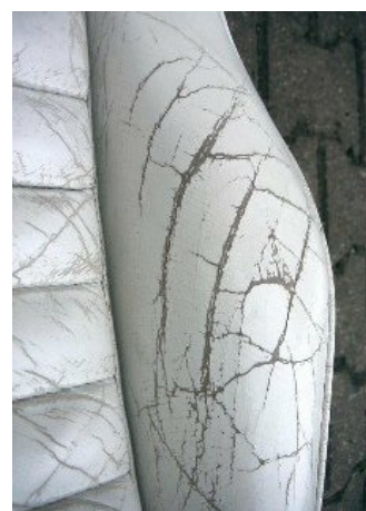
Cas typiques pour une réparation.