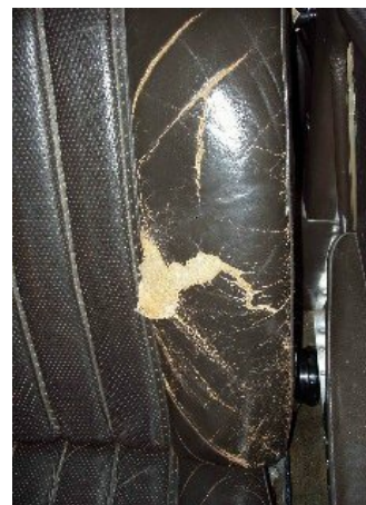
Exemples de cuirs trop cassés ou trop vieux pour une réparation.

Le nettoyage et l'entretien du cuir automobile